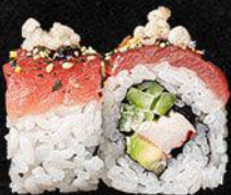
Maguro Avocado Roll

- Krab, avocado, komkommer, tonijn en furikake - 16,5