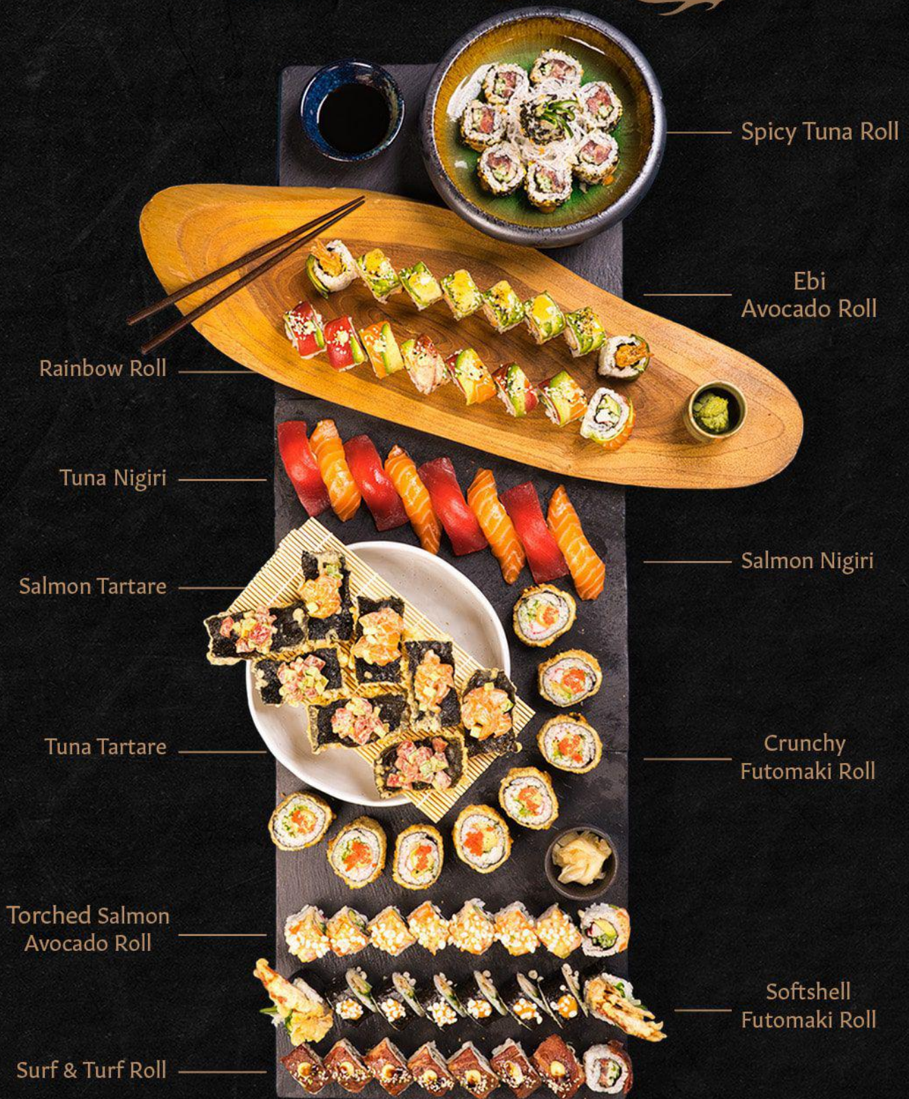
Spicy Tuna Roll