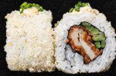
Tempura Chicken Roll