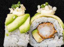
Ebi Avocado Roll

- Krab, avocado, komkommer, tonijn en furikake - 16,5