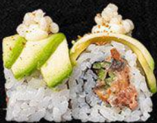
Spicy Tuna Avocado Roll

- Pittige tonijn, komkommer en furikake - 16,5