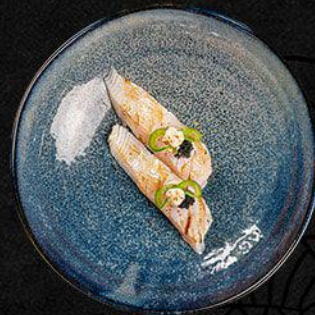
Torched Hamachi Nigiri

- Geschroeide Hamachi Yellowtail nigiri -