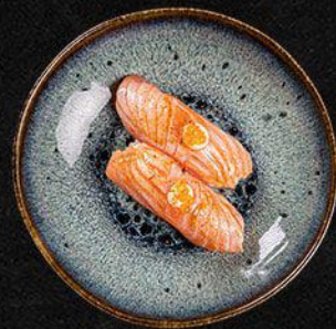
Torched Salmon Nigiri