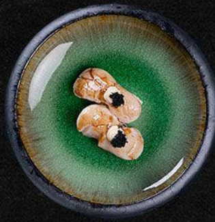
Torched Hotate Nigiri