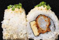
Tempura Ebi Roll

- Pittige tonijn, komkommer en furikake - 16,5