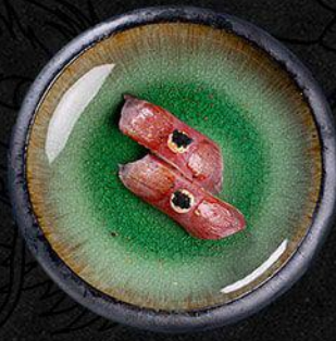
Torched Tuna Nigiri